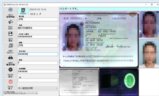
③OCR、IC 通信を自動的に行い パソコン画面に結果を表示