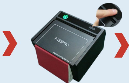
②パスポートをセットし スタートボタンを押す