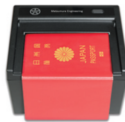
パスポートリーダー PASSPRO®