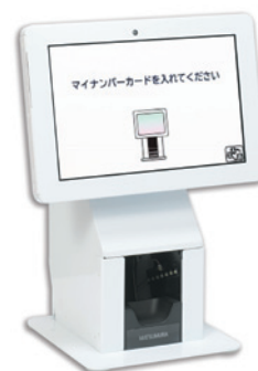
顔認証付きカードリーダー