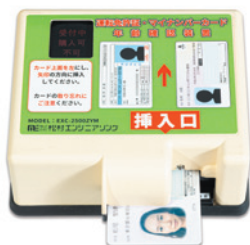
運転免許証・マイナンバーカード 年齢識別装置

運転免許証、マイナンバーカード、在留カード、パスポートなど、さまざまな身分証明書で本人確認や年齢確認を実施。電力会社の施設やプラントシステムへの入館管理、金融機関や各種販売代理店の契約・申し込み審査時の本人確認・年齢確認の正確化、地方自治体や企業のコンプライアンス対策など、導入実績も多数。たばこやアルコール、成人向け雑誌・商品などの自動販売機対策にも貢献。また、パソコン接続によるデータ管理や、マイナンバーカードのサインパネル領域への印字システムなど、これまで個々に扱っていた複数の悩みを一括して解決する斬新な企画で、一段と合理化を進める製品を日本全国に拡げ、入力業務の効率化にも役立っています。