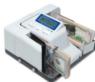
多通貨紙幣鑑別機 MATSUMURA 4+1®