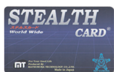
スキミング防止カード STEALTH CARD®

カギ穴が無いのでピッキングが物理的にできない電子錠。高い防犯性で幅広い信用を獲得し、戸建てやマンション、保育園、老人ホームなどの介護施設、中央官公庁の施設、警察署など国家の安全を守る公的施設への採用など、市場が拡大し続けています。また、カード情報の不正な読み取りを防ぐスキミング防止カードなど、日常に起こりうる犯罪を抑止して、安全・安心な毎日を守ります。さらに、医療機関の受診受付を正確・スムーズに行える顔認証付きカードリーダーなど、健康分野にも貢献しています。