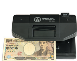
簡易鑑別器 イージスチェッカー DX

世界中の銀行、空港、税関、両替所、ホテル、免税店など、外貨両替業務の多様な場面で、豊富な実績と高い評価を誇ります。また、量販店、郵便局、さらには捜査当局など、国家の安全を担うあらゆる場面で活躍。肉眼では判別のつかない精巧な偽造紙幣を瞬時に鑑別し、不正使用を水際で食い止めます。