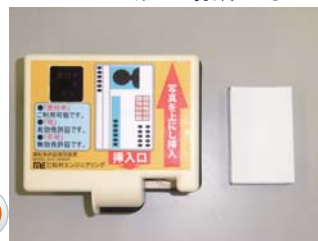
たばこ（ショート）サイズと比較

スタンドアロン方式採用により、コンセントを差すだけで使用できます。パソコンや設定が不要な為、簡単に導入できます。コンパクト設計の為、スペースの無い場所でも設置する事が可能です。