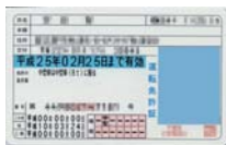
非 IC 運転免許証