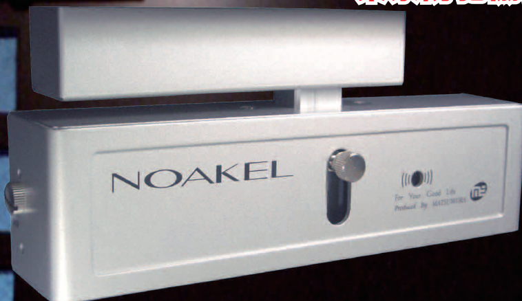
リモコンロック NOAKEL EXC-7500D