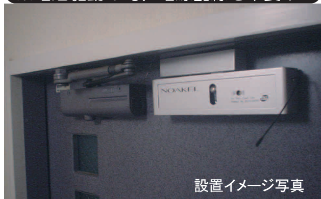
設置イメージ写真