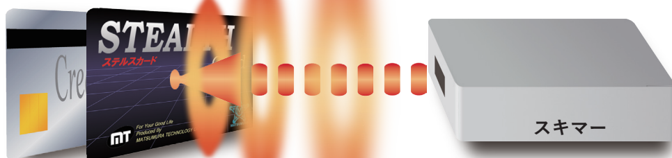
※スキミング防止イメージ